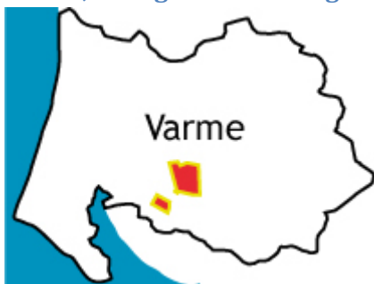
Figur 4. Forsyningsområde Varme

Varde Forsyning A/S' hovedaktivitet består i at forestå driften af opgaver forbundet med levering af varme til husstande og virksomheder i Varde Kommune. Overordnet er der tale om gennemførelse af: