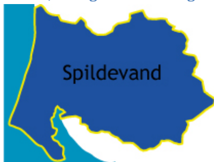
Figur 2. Forsyningsområde Spildevand

Varde Forsyning A/S' hovedaktivitet består i at forestå driften af opgaver forbundet med afledning af spildevand fra husstande og virksomheder i Varde Kommune. Overordnet er der tale om gennemførelse af: