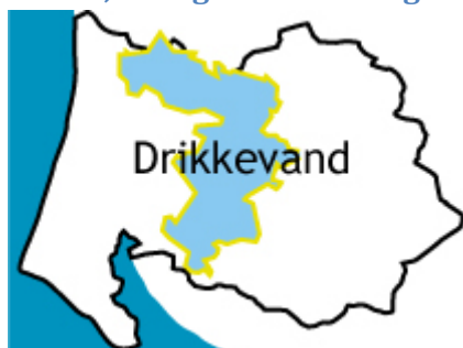
Figur 1. Forsyningsområde Drikkevand

Varde Forsyning A/S' hovedaktivitet består i at forestå driften af opgaver forbundet med levering af drikkevand til husstande og virksomheder i Varde Kommune. Overordnet er der tale om gennemførelse af: