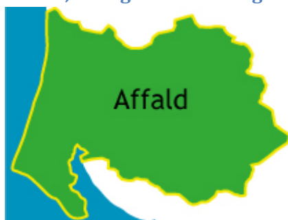
Figur 3. Forsyningsområde Affald

Varde Forsyning A/S' hovedaktivitet består i at forestå driften af kommunale opgaver forbundet med håndtering af affald fra husstande og virksomheder i Varde Kommune. Overordnet er der tale om gennemførelse af: